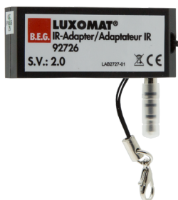
IR-adapter okostelefonokhoz Art.No: 92726

Méreték: 40 x 55 x 103 mm Anyag színe: fekete Frekvencia: 2.4 GHz ISM band, GFSK 0.2 dBm + 5.3 dBi = 5.5 dBm