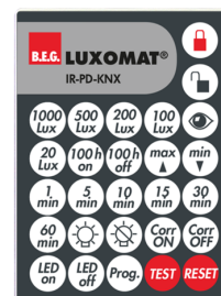
IR-PD-KNX Art.No: 92123

Méreték: 47 x 19 x 10 mm Védettség / Érintésvédelmi osztály: IP20 Környezeti hőmérséklet: -20 °C - +40 °C