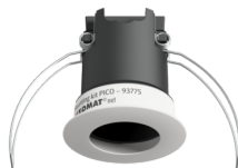
Szerelőkészlet PICO Art.No: 93775

Méreték: 57 x 35 x 7 mm Anyag színe: - Akkumulátor: Lítium 3.0 V<BR>0 mAh