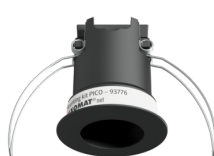
Szerelőkészlet PICO Art.No: 93776

Méreték: Ø 45 x 50 mm Védettség / Érintésvédelmi osztály: IP20 Ház: Magas UV állóságú polikarbonát