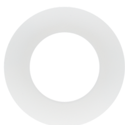
Fedőgyűrű PD9 Ø 36 mm Cikkszám: 92238

Méreték: Ø 36 mm Ház: UV-álló polikarbonát Anyag színe: antracit fényes