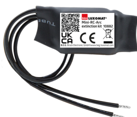
Mini-RC egység Art.No: 10882

Hálózati feszültség: 230 V AC ±10% Méreték: 38 x 12 x 26 mm Védettség / Érintésvédelmi osztály: IP20 / II. osztály