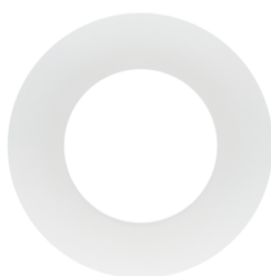
Fedőgyűrű PD9 Ø 36 mm Cikkszám: 92238

Méreték: Ø 36 mm Ház: UV-álló polikarbonát Anyag színe: antracit fényes