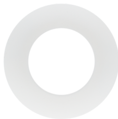
Gyűrű PD9 Ø 36 mm Art.No: 92238

Méreték: Ø 36 mm Ház: Magas UV állóságú polikarbonát Anyag színe: antracit fényes