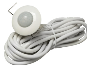
PD9-S-SDB-DE Cikkszám: 92915

Hálózati feszültség: 230 V AC ±10% Méreték: 50 x 23 x 8 mm Védettség / Érintésvédelmi osztály: IP20 / II. osztály