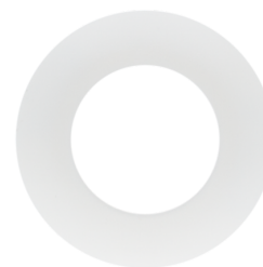
Gyűrű PD9 Ø 36 mm Art.No: 92238

Méreték: Ø 36 mm Ház: Magas UV állóságú polikarbonát Anyag színe: antracit fényes