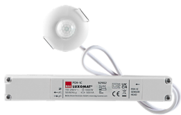
PD9-1C-DE Art.No: 92902

To receive the bundle according to the technical specification, please order the items listed.