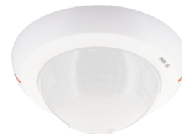
folyosói lencse PD4N típus A, Fedőgyűrű Cikkszám: 93742

Érzékelési terület: vízszintes 360° (felületre szerelhető) Érzékelési távolság: max. &Oslash; 24 m áthaladás <br>max. &Oslash; 8 m megközelítés <br>max. &Oslash; 6.4 m kis mozgások Megfigyelt terület (hosszirányú megközelítésnél): 450 m 2 / 2.5 m szerelési magasság