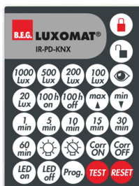
IR-PD-KNX Cikkszám: 92123

Méretek: 40 x 55 x 103 mm Anyag színe: fekete Frekvencia: 2.4 GHz ISM-sáv, GFSK 0.2 dBm + 5.3 dBi = 5.5 dBm