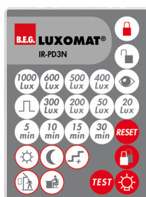
IR-PD3N Art.No: 92105

Méret: 47 x 19 x 10 mm Védettség / Érintésvédelmi osztály: IP20 Környezeti hőmérséklet: -20 °C - +40 °C