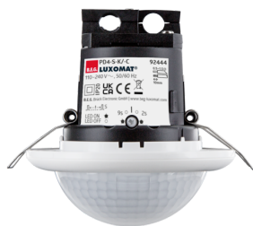
PD4-S-K-DE Art.No: 92444

To receive the bundle according to the technical specification, please order the items listed.