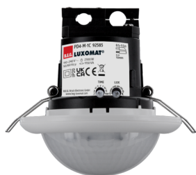
PD4-M-1C-DE Art.No: 92585

To receive the bundle according to the technical specification, please order the items listed.