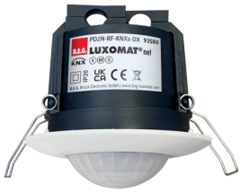
PD2N-RF-KNXs-DX-DE Cikkszám: 93580

A csomag műszaki specifikációnak megfelelő megkapásához kérjük, rendelje meg a felsorolt tételeket.