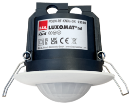
PD2N-RF-KNXs-DX-DE Cikkszám: 93580

A csomag műszaki specifikációnak megfelelő megkapásához kérjük, rendelje meg a felsorolt tételeket.