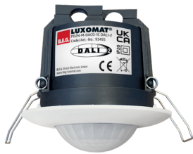
PD2N-M-DACO-1C DALI-2 Cikkszám: 93455

A csomag műszaki specifikációnak megfelelő megkapásához kérjük, rendelje meg a felsorolt tételeket.