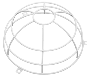
Védőrács BSK ( \varnothing 200 \times 90 mm) Cikkszám: 92199

Méretek: \varnothing 106 \times 20 mm Ütésállóság: IK05 Ház: UV-álló polikarbonát