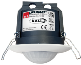
PD2N-M-DACO-1C DALI-2 Cikkszám: 93455

A csomag műszaki specifikációnak megfelelő megkapásához kérjük, rendelje meg a felsorolt tételeket.