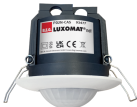
PD2N-CAS Art.No: 93477

To receive the bundle according to the technical specification, please order the items listed.