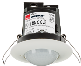
PD2-S-DE Art.No: 92166

To receive the bundle according to the technical specification, please order the items listed.