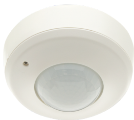
PD2-S-AP Art.No: 92152

To receive the bundle according to the technical specification, please order the items listed.