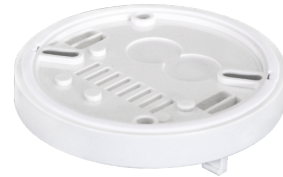
AP aljzat IP54 -hoz PD2- / PD4-AP Cikkszám: 92161

Méretek: Ø 200 x 90 mm Ütésállóság: IK09 Ház: felületkezelte acélkosár