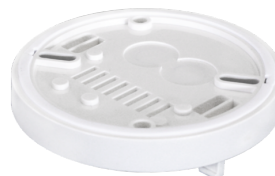
AP aljzat IP54 -hoz PD2- / PD4-AP Cikkszám: 92161

Méretek: Ø 200 x 90 mm Ütésállóság: IK09 Ház: felületkezelte acélkosár