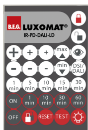
IR-PD-DALI-LD Art.No: 92652

Méreték: 80 x 60 x 8 mm Anyag színe: - Akkumulátor: Lítium 3.0 V<BR>0 mAh