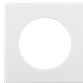
Négyszögletes dizájn keret PD11-DE Cikkszám: 92994

Méreték: Ø 100 x 3 mm Ház: UV-álló polikarbonát Anyag színe: fehér matt, hasonló RAL9010