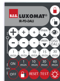
IR-PD-DALI Art.No: 92094

Méreték: 47 x 19 x 10 mm Védettség / Érintésvédelmi osztály: IP20 Környezeti hőmérséklet: -20 °C - +40 °C