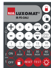
IR-PD-DALI Cikkszám: 92094

Méreték: 47 x 19 x 10 mm Védetség / Érintésvédelmi osztály: IP20 Környezeti hőmérséklet: -20 °C - +40 °C