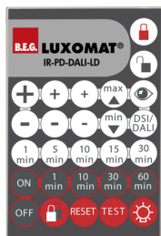
IR-PD-DALI-LD Cikkszám: 92652

Méreték: 80 x 60 x 8 mm Anyag színe: - Akkumulátor: Lítium 3.0 V <BR>0 mAh