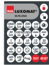
IR-PD-KNX Cikkszám: 92123

Méreték: 47 x 19 x 10 mm Védettség / Érintésvédelmi osztály: IP20 Környezeti hőmérséklet: -20 °C - +40 °C