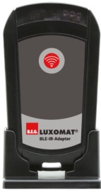
BLE-IR-Adapter Cikkszám: 93067

Méreték: 40 x 55 x 103 mm Anyag színe: fekete Frekvencia: 2.4 GHz ISM-sáv, GFSK 0.2 dBm + 5.3 dBi = 5.5 dBm