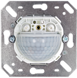
Indoor 180-R-11-48V-RR burkolatot nem tartalmazza Cikkszám: 92667

A csomag műszaki specifikációnak megfelelő megkapásához kérjük, rendelje meg a felsorolt tételeket.