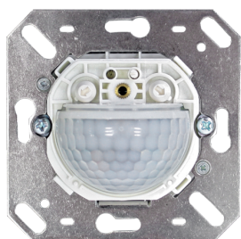
Indoor 180-R-11-48V-RR burkolatot nem tartalmazza Cikkszám: 92667

A csomag műszaki specifikációnak megfelelő megkapásához kérjük, rendelje meg a felsorolt tételeket.