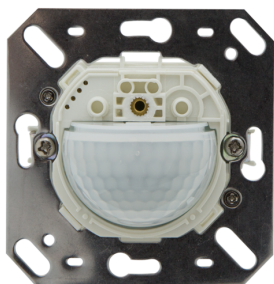
Indoor 180-KNXs-DX fedelet nem tartalmazza Art.No: 93525

To receive the bundle according to the technical specification, please order the items listed.