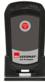
BLE-IR-Adapter Art.No: 93067

Hálózati feszültség: 230 V AC \pm 10\% Méretek: 50 x 23 x 8 mm Védettség / Érintésvédelmi osztály: IP20 / II. osztály