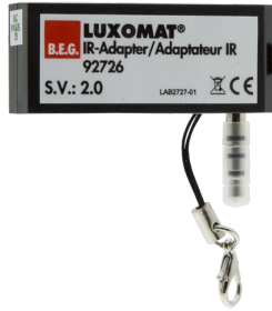
Adaptateur IR avec App Ref.: 92726

Dimensions: 40 x 55 x 103 mm Couleur du matériau: noir Fréquence: 2.4 GHz bande ISM, GFSK 0.2 dBm + 5.3 dBi = 5.5 dBm