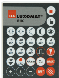
IR-RC Ref.: 92000

Dimensions: 40 x 55 x 103 mm Couleur du matériau: noir Fréquence: 2.4 GHz bande ISM, GFSK 0.2 dBm + 5.3 dBi = 5.5 dBm