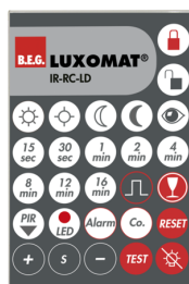
IR-RC-LD Ref.: 92649

Batterie: 3.0 V Lithium CR2032 (compris dans la livraison) Dimensions: 80 x 60 x 8 mm Couleur du matériau: -