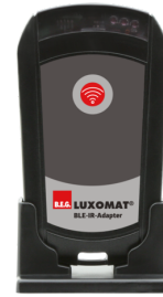
Adapter BLE-IR Ref.: 93067

Tension: 230 V AC ±10% Dimensions: 50 x 23 x 8 mm Niveau de protection: IP20 / Classe II