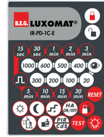
IR-PD-1C-E Ref.: 92077

Tension: 230 V AC \pm 10\% Dimensions: 38 x 12 x 26 mm Niveau de protection: IP20 / Classe II