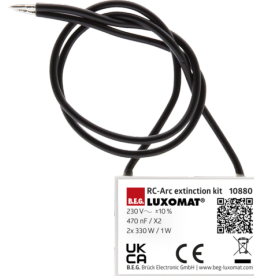
RC-Filtre Anti-Arc Ref.: 10880

Batterie: 3.0 V Lithium CR2032 (compris dans la livraison) Dimensions: 80 x 60 x 8 mm Couleur du matériau: -