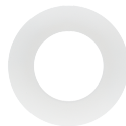
Collerette PD9 Ø 36 mm Ref.: 92238

Dimensions: Ø 36 mm Boîtier: Polycarbonate, résistant aux UV Couleur du matériau: anthracite brillant