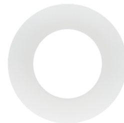
Collerette PD9 Ø 36 mm Ref.: 92238

Dimensions: Ø 36 mm Boîtier: Polycarbonate, résistant aux UV Couleur du matériau: anthracite brillant