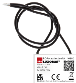
RC-Filtre Anti-Arc Ref.: 10880

Dimensions: 40 x 55 x 103 mm Couleur du matériau: noir Fréquence: 2.4 GHz bande ISM, GFSK 0.2 dBm + 5.3 dBi = 5.5 dBm