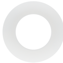
Collerette PD9 Ø 36 mm Ref.: 92238

Dimensions: Ø 36 mm Boîtier: Polycarbonate, résistant aux UV Couleur du matériau: anthracite brillant