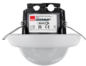
PD4N-M-DACO-DUO DALI-2 Ref.: 93461

Pour obtenir le bundle conformément à la spécification technique, veuillez commander les articles mentionnés.