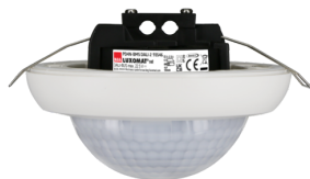
PD4N-BMS DALI-2 Ref.: 93546

Pour obtenir le bundle conformément à la spécification technique, veuillez commander les articles mentionnés.