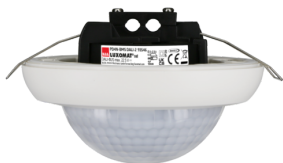
PD4N-BMS DALI-2 Ref.: 93546

Pour obtenir le bundle conformément à la spécification technique, veuillez commander les articles mentionnés.