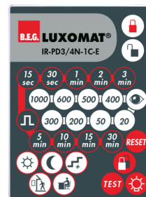
IR-PD3/4N-1C-E Ref.: 93110

Batterie: 3.0 V Lithium CR2032 (compris dans la livraison) Dimensions: 80 x 60 x 8 mm Couleur du matériau: -