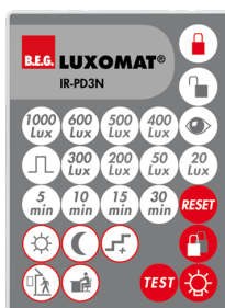
IR-PD3N Ref.: 92105

Dimensions: 47 x 19 x 10 mm Niveau de protection: IP20 Température ambiante: -20 °C à +40 °C