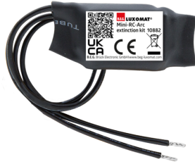
Mini-RC-Filtre Anti-Arc Ref.: 10882

Tension: 230 V AC \pm 10\% Dimensions: 38 x 12 x 26 mm Niveau de protection: IP20 / Classe II