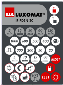
IR-PD3N-2C Ref.: 92115

Dimensions: 40 x 55 x 103 mm Couleur du matériau: noir Fréquence: 2.4 GHz bande ISM, GFSK 0.2 dBm + 5.3 dBi = 5.5 dBm