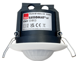
PD2N-RF-KNXs-DX-FP Ref.: 93580

Pour obtenir le bundle conformément à la spécification technique, veuillez commander les articles mentionnés.