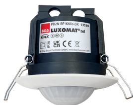
PD2N-RF-KNXs-DX-FP Ref.: 93580

Pour obtenir le bundle conformément à la spécification technique, veuillez commander les articles mentionnés.