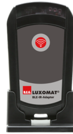
Adapter BLE-IR Ref.: 93067

Tension: 230 V AC \pm 10\% Dimensions: 50 x 23 x 8 mm Niveau de protection: IP20 / Classe II