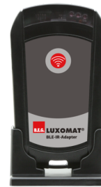
Adapter BLE-IR Ref.: 93067

Tension: 230 V AC \pm 10\% Dimensions: 50 x 23 x 8 mm Niveau de protection: IP20 / Classe II