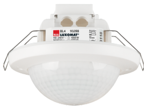
BL4-FP Ref.: 93288

Pour obtenir le bundle conformément à la spécification technique, veuillez commander les articles mentionnés.