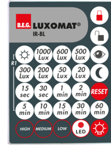
IR-BL Ref.: 93055

Tension: 230 V AC \pm 10\% Dimensions: 50 x 23 x 8 mm Niveau de protection: IP20 / Classe II