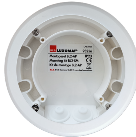
Set de montage BL2-AP Ref.: 93256

Dimensions: 40 x 55 x 103 mm Couleur du matériau: noir Fréquence: 2.4 GHz bande ISM, GFSK 0.2 dBm + 5.3 dBi = 5.5 dBm