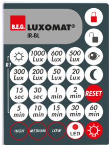
IR-BL Ref.: 93055

Dimensions: 40 x 55 x 103 mm Couleur du matériau: noir Fréquence: 2.4 GHz bande ISM, GFSK 0.2 dBm + 5.3 dBi = 5.5 dBm