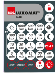
IR-BL Ref.: 93055

Tension: 230 V AC \pm 10\% Dimensions: 50 x 23 x 8 mm Niveau de protection: IP20 / Classe II