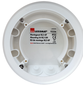
Set de montage BL2-AP Ref.: 93256

Dimensions: 40 x 55 x 103 mm Couleur du matériau: noir Fréquence: 2.4 GHz bande ISM, GFSK 0.2 dBm + 5.3 dBi = 5.5 dBm