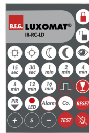
IR-RC-LD Ref.: 92649

Batterie: 3.0 V Lithium CR2032 (compris dans la livraison) Dimensions: 80 x 60 x 8 mm Couleur du matériau: -