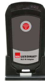
Adaptateur BLE-IR Ref.: 93067

Tension: 230 V AC ±10% Dimensions: 50 x 23 x 8 mm Niveau de protection: IP20 / Classe II