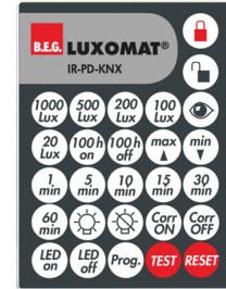
IR-PD-KNX Ref.: 92123

Dimensions: 47 x 19 x 10 mm Niveau de protection: IP20 Température ambiante: -20 °C à +40 °C