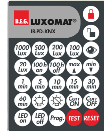
IR-PD-KNX Ref.: 92123

Dimensions: 47 x 19 x 10 mm Niveau de protection: IP20 Température ambiante: -20 °C à +40 °C