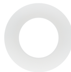
Collerette PD9 Ø 36 mm Ref.: 92238

Dimensions: Ø 36 mm Boîtier: Polycarbonate, UV-résistant Couleur du matériau: anthracite brillant